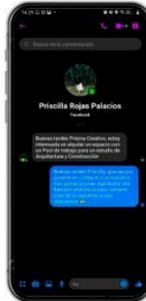
COMUNICACIÓN Y AGENDA