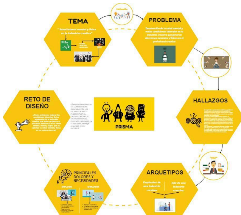
Esquema de Propuesta de servicio