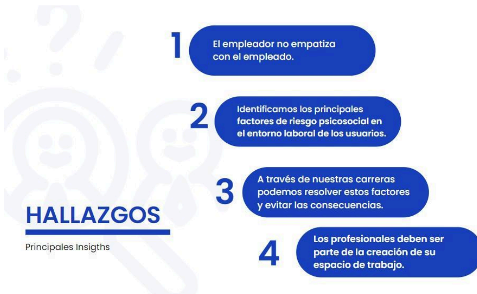
Lienzo de Insights hallados