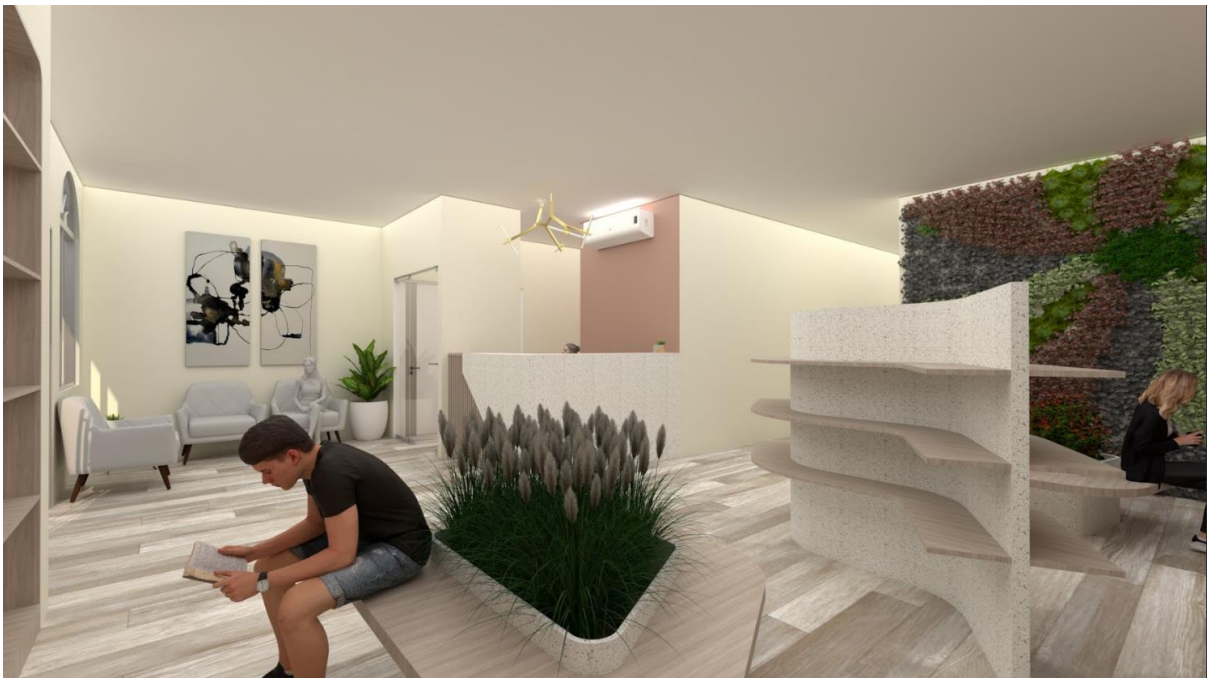
Espacio principal otra vista