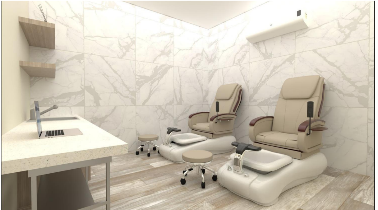
Sala de podología