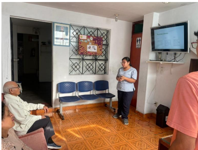
Taller de Empoderamiento