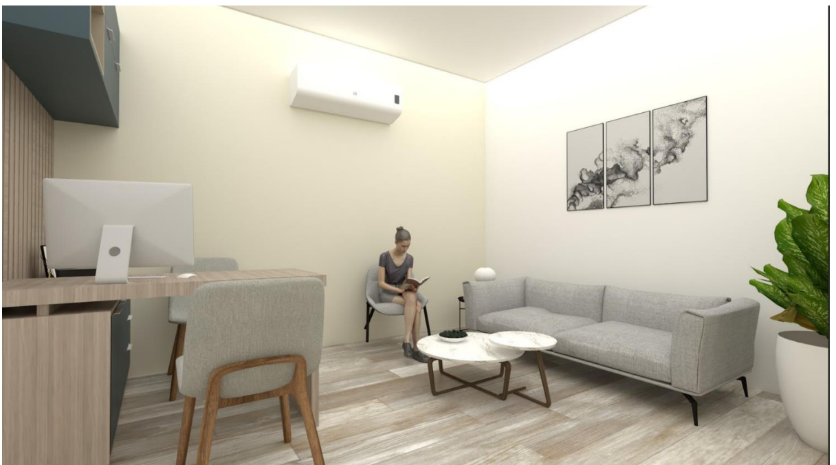
Oficina de psicología