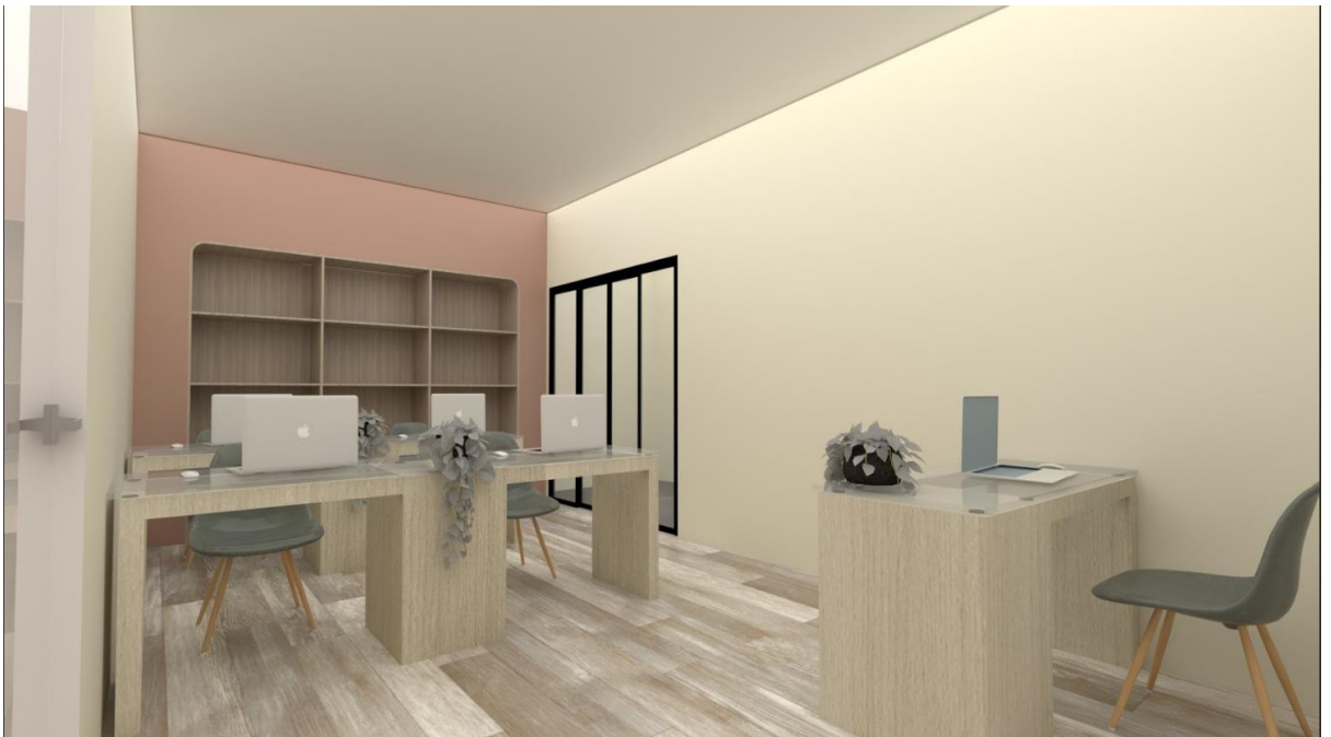
Salón de tecnología