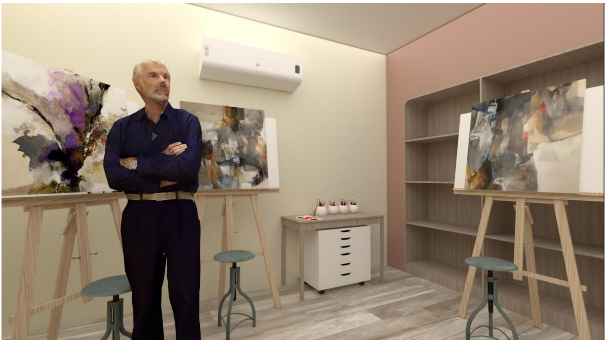
Salón de arte