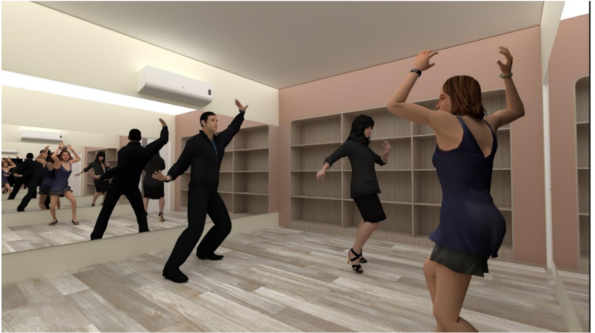
Salón de baile