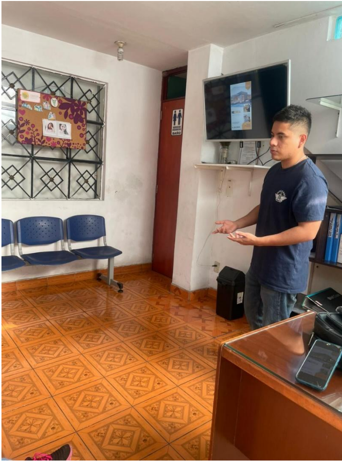
Explicación del flyer