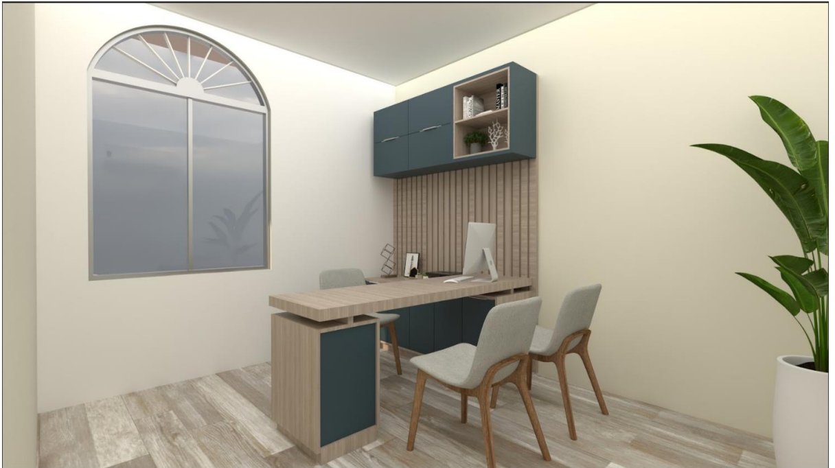
Oficina de inscripción