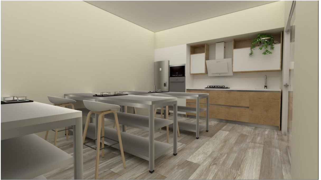
Salón de gastronomía