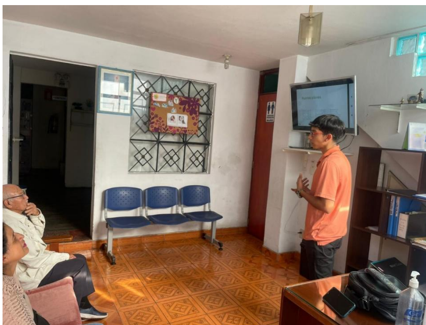
Taller de Empoderamiento