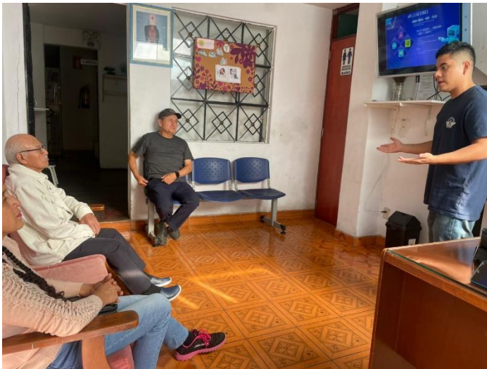
Taller de Tecnología