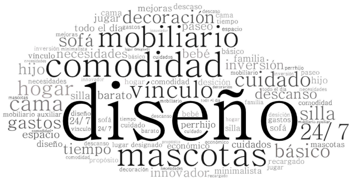
Figura 2: Lluvia de palabras. Nota: Recopilación de respuestas sobre las entrevistas.